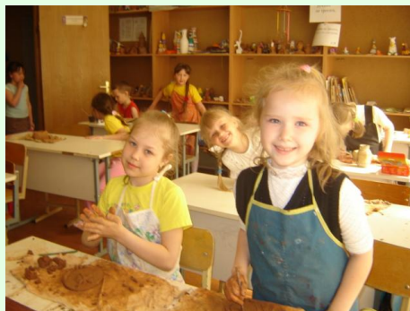
ХУДОЖЕСТВЕННОЕ ОТДЕЛЕНИЕ с. 12