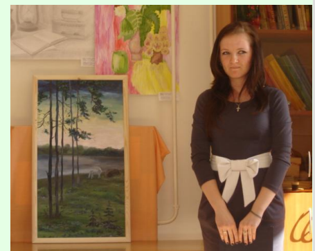
ВЕСТИ ИЗ СТРУКТУРНЫХ ПОДРАЗДЕЛЕНИЙ с. 19-20