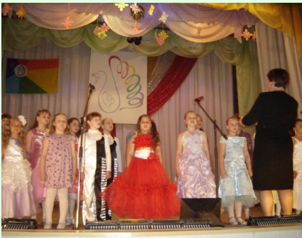
ХОРОВОЕ ОТДЕЛЕНИЕ с. 4-7

СОБЫТИЯ УХОДЯЩЕГО 2011-2012 учебного года