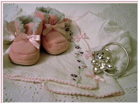
MY LITTLE THINGS