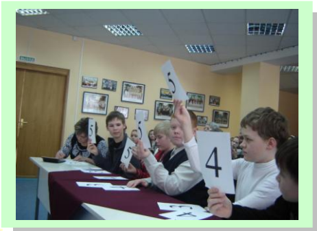
Жюри за работой