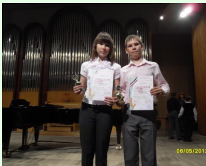
ОТДЕЛЕНИЕ ИНСТРУМЕНТАЛЬНОГО ИСПОЛНИТЕЛЬСТВА с.13-16