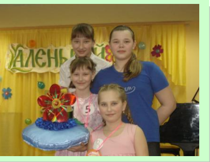
Фотография на память