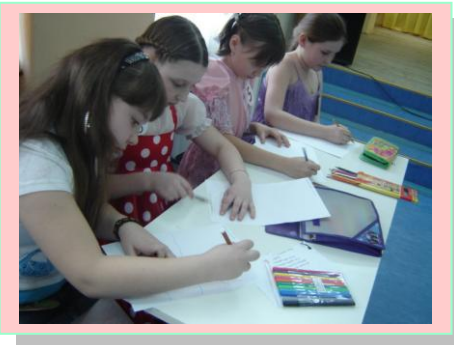
Конкурс «Нарисуй весну»