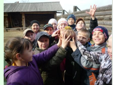
ФОЛЬКЛОРНОЕ ОТДЕЛЕНИЕ с.8-11