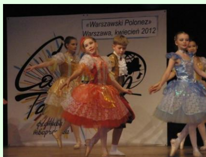
ХОРЕОГРАФИЧЕСКОЕ ОТ- ДЕЛЕНИЕ с. 17-18