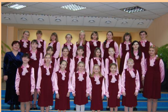
ХОР « СОЛОВУШКА»

Дорогие учителя, я хочу выразить большую благодарность за Вашу душевную щедрость, доброжелательность и педагогический талант. Вы открыли для меня новый неповторимый мир, музыкальный мир. Вы зажгли в моём сердце любознательность, веру в себя, благодаря Вам я нашла свою индивидуальность. Ваша любовь и доброта открыли во мне новые таланты, наполнили мою жизнь интересными увлечениями.