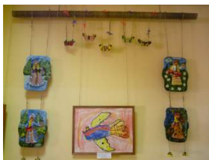
«Времена года» Поварницин Павел