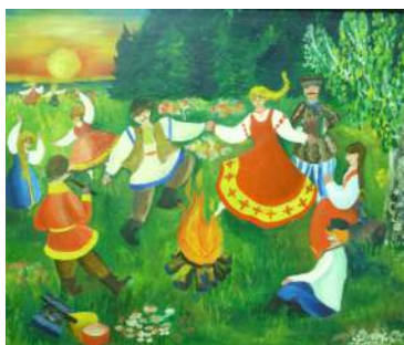
«Народный праздник Иван Купала» Пастухова Валерия